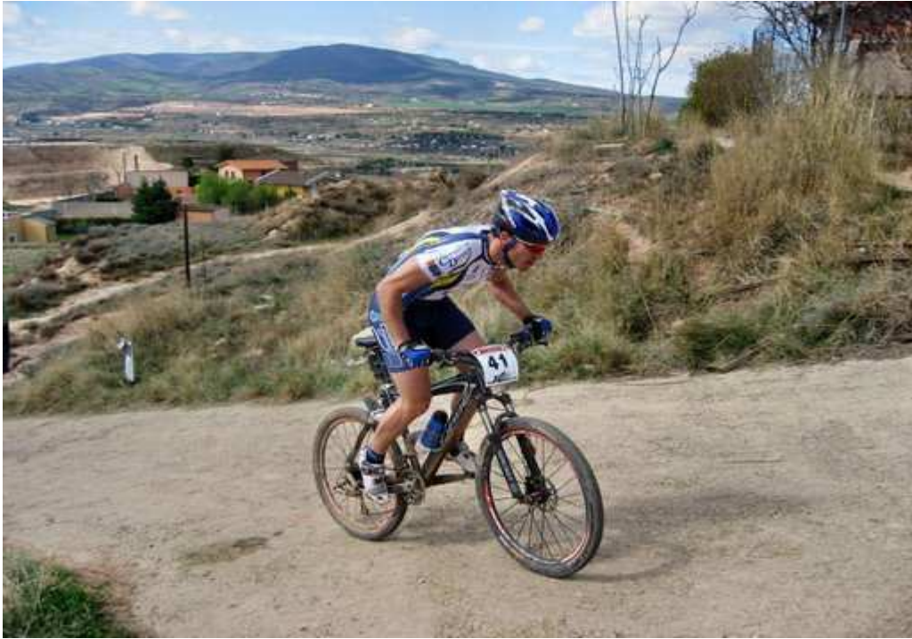
ALBELDA DE IREGUA (LA RIOJA). 17º CLASIFICADO ELITE PRO