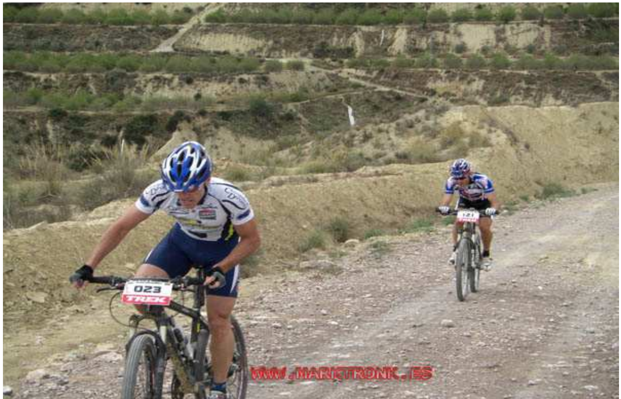
MARATON DE TORREAGUERA, SIERRA DEL MIRAVETE. 1º CLASIFICADO ELITE.