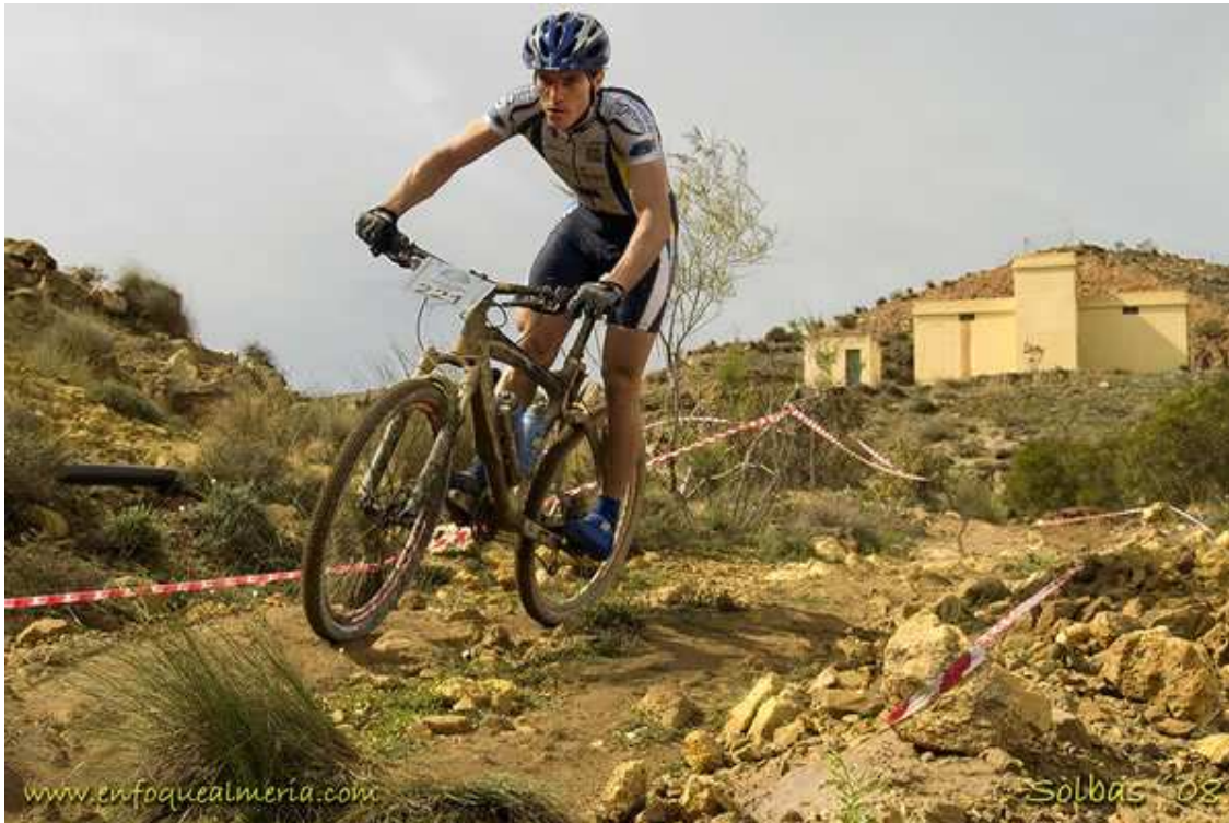
ÚLTIMA PRUEBA DEL OPEN DE ALMERIA 2008. 3º CLASIFICADO ELITE.