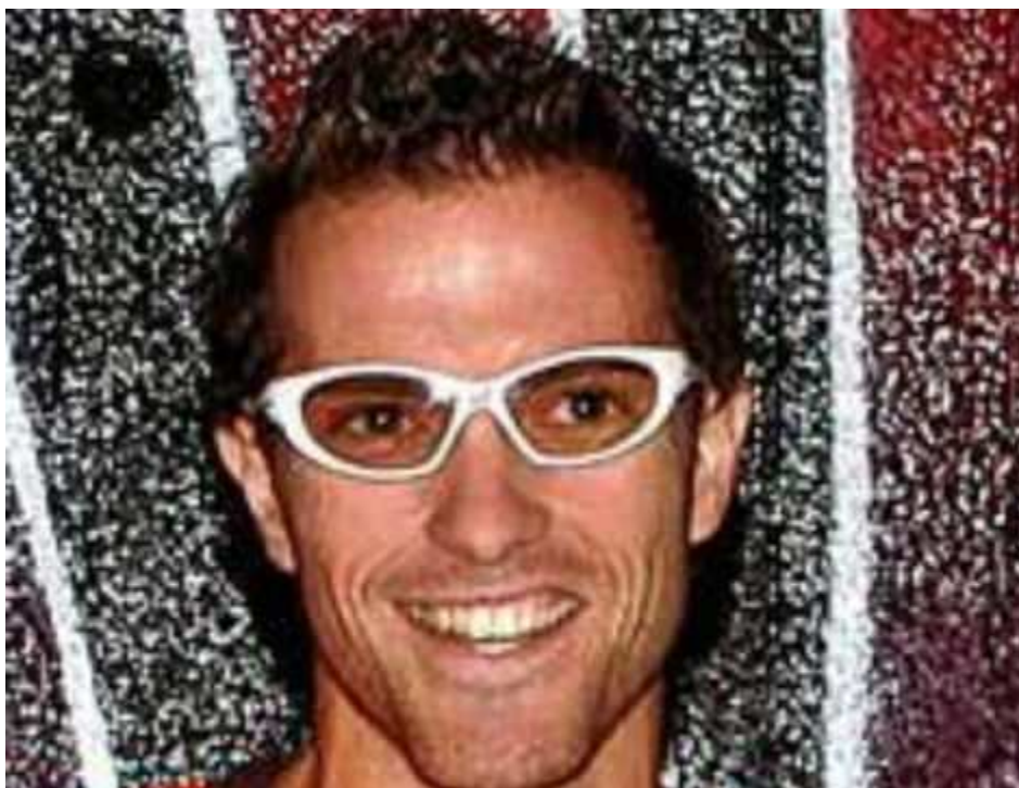
foto del podium del triatlón festibike 2004