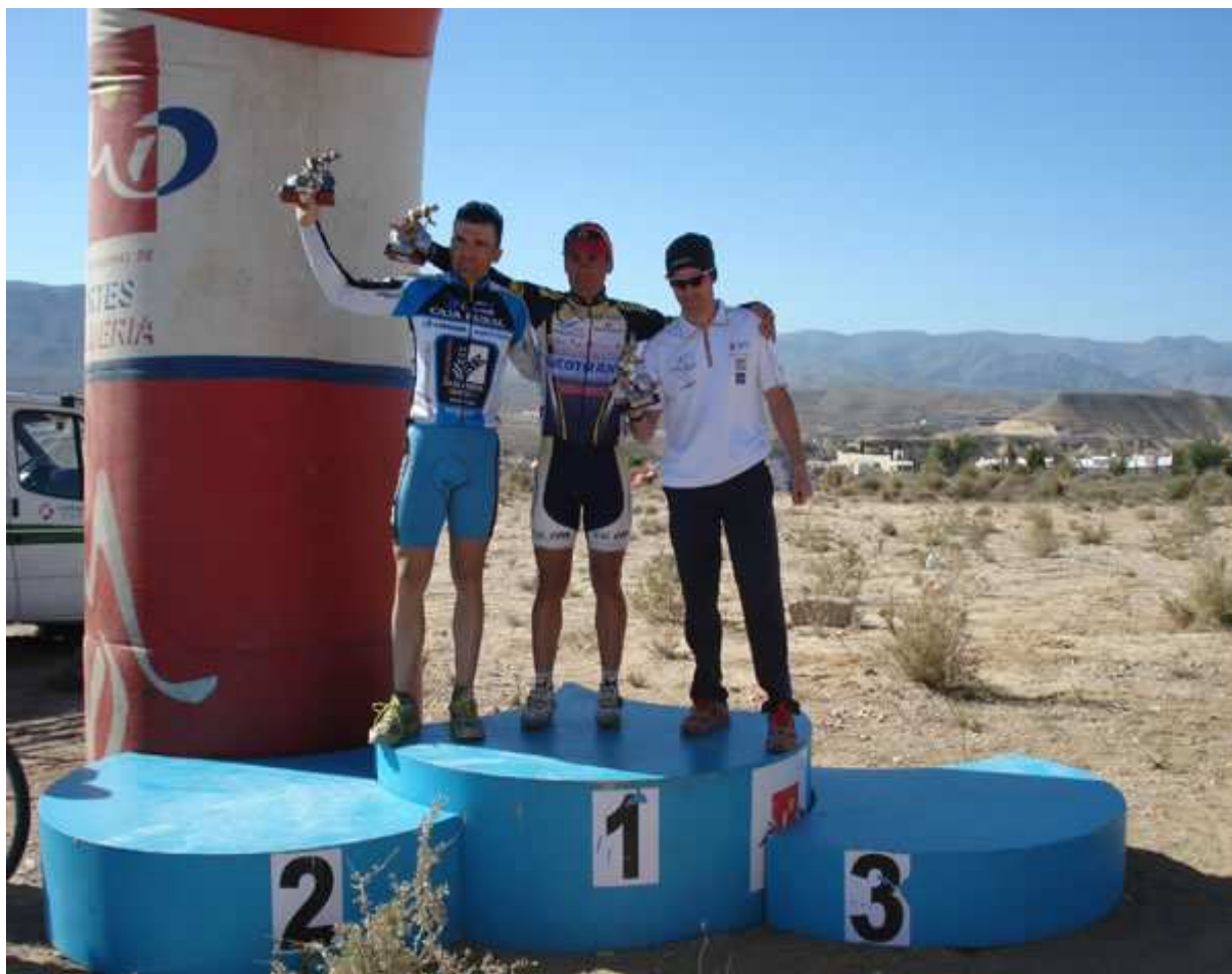
3º CLASIFICADO EN LA GENERAL FINAL DEL OPEN DE ALMERIA 2008