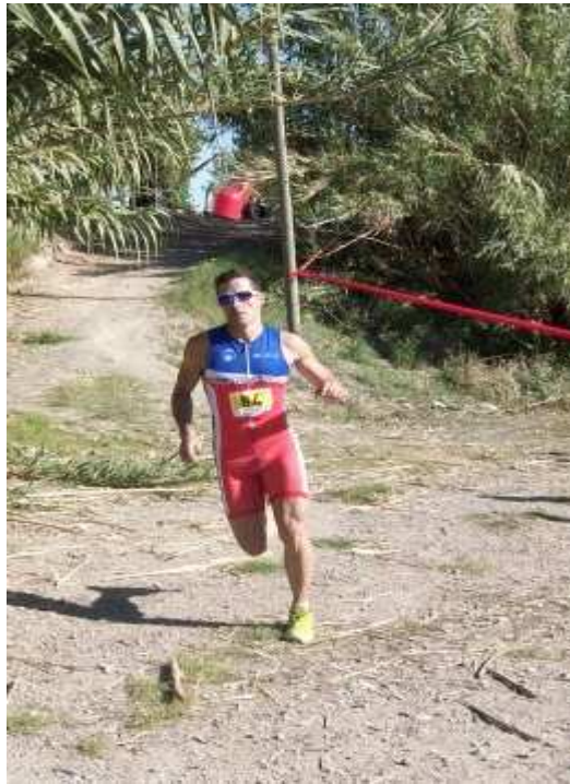
4º Clasificado Duatlón Cross de Puerto Lumbreras 2009