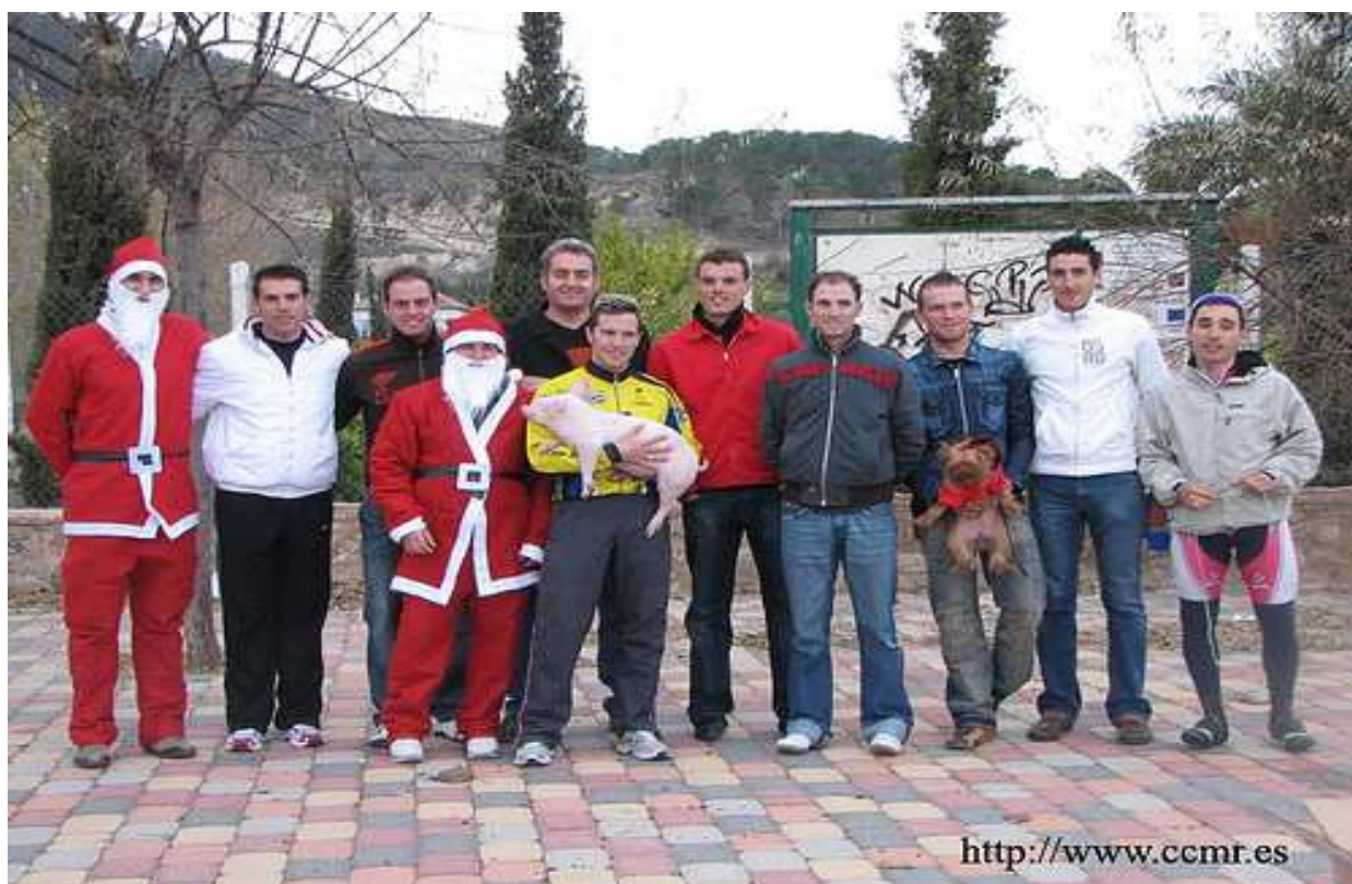
SUBIDA DEL COHINILLO, JUNTO A TODOS LOS CICLISTAS PROFESIONALES DE CARRETERA DE LA REGION DE MURCIA.