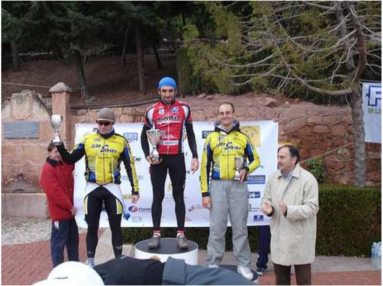
MEMORIAL DOMINGO PEREGRIN, NOVIEMBRE 2007 TOTANA.